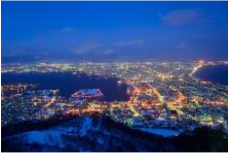
วิวยามค่ำคืนเมืองฮาโกดาเตะ