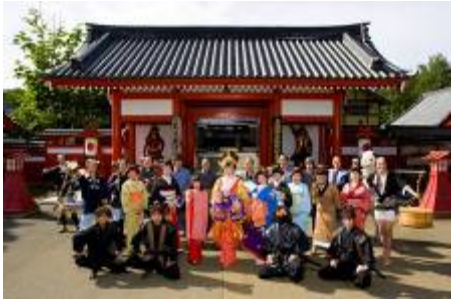
หมู่บ้านนินจา