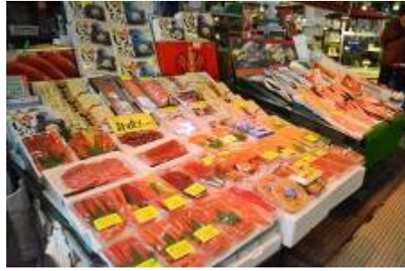
ตลาดปลาฮาโกดาเตะ